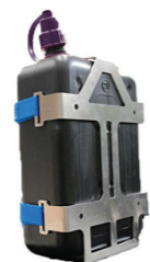
Tank and tank holder